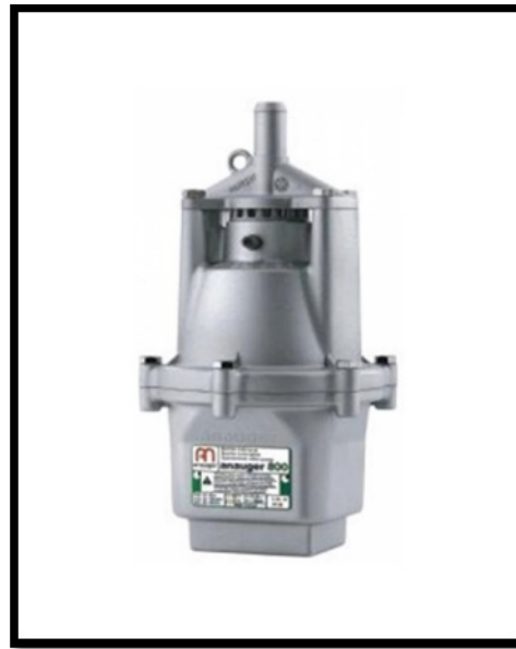
Figura 2. Bomba Anauger 800 Fonte: INDÚSTRIA..., 2013 14

abastecido somente pela empresa de distribuição de água do município, sendo esse o Serviço Autônomo de Água e Esgoto de Colina (SAAEC) 15 e terá como finalidade atender as demandas para fins mais nobres. O segundo reservatório será abastecido com água proveniente das precipitações pluviométricas armazenadas nos reservatórios terrestres, através de uma bomba submersa vibratória, marca anauger 14 , modelo 800, com potência nominal de 380 watts, tendo elevação máxima de 65 metros, características essas que atendem perfeitamente aos requisitos demandados pelo projeto em questão. (Figura 2). Os pontos de consumos de água da edificação que serão abastecidos pela água pluvial captada, de acordo com a NBR15.527/2007 9 , devem ter uso restrito além de estarem devidamente sinalizados com a inscrição “água não potável”, e, também, por indicação gráfica.