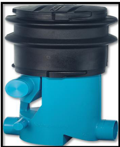
Figura 1. Filtro VF1 3P Telescópico Fonte: TECHNIK..., 2012. 12

Após análise detalhada dos equipamentos disponíveis no mercado, chegou-se à conclusão, que um filtro que abriga as necessidades técnicas para o projeto e não causa desequilíbrio orçamentário é o filtro VF1 3P Telescópico, conforme demonstrado na figura 1.